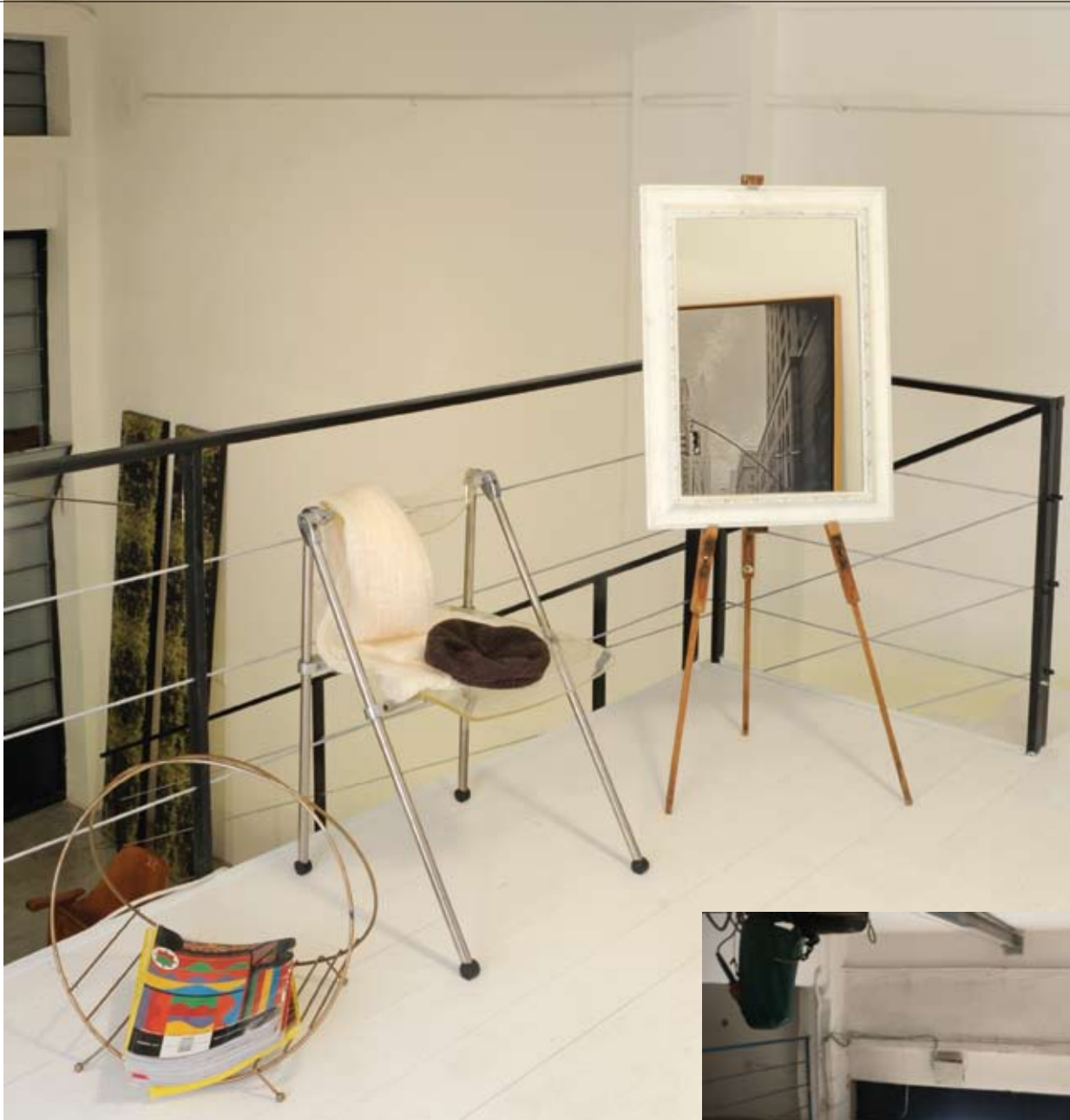
מבט מגלריית השינה אל החלל תחתיה. מימין בקטן: מבט מהמפלס העליון אל הרחוב לפני השיפוץ.