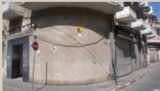
למעלה: הבניין אחרי שנפרצו בו הפתחים החדשים. משמאל: הבניין לפני הכשרתו למגורים ופריצת הפתחים.