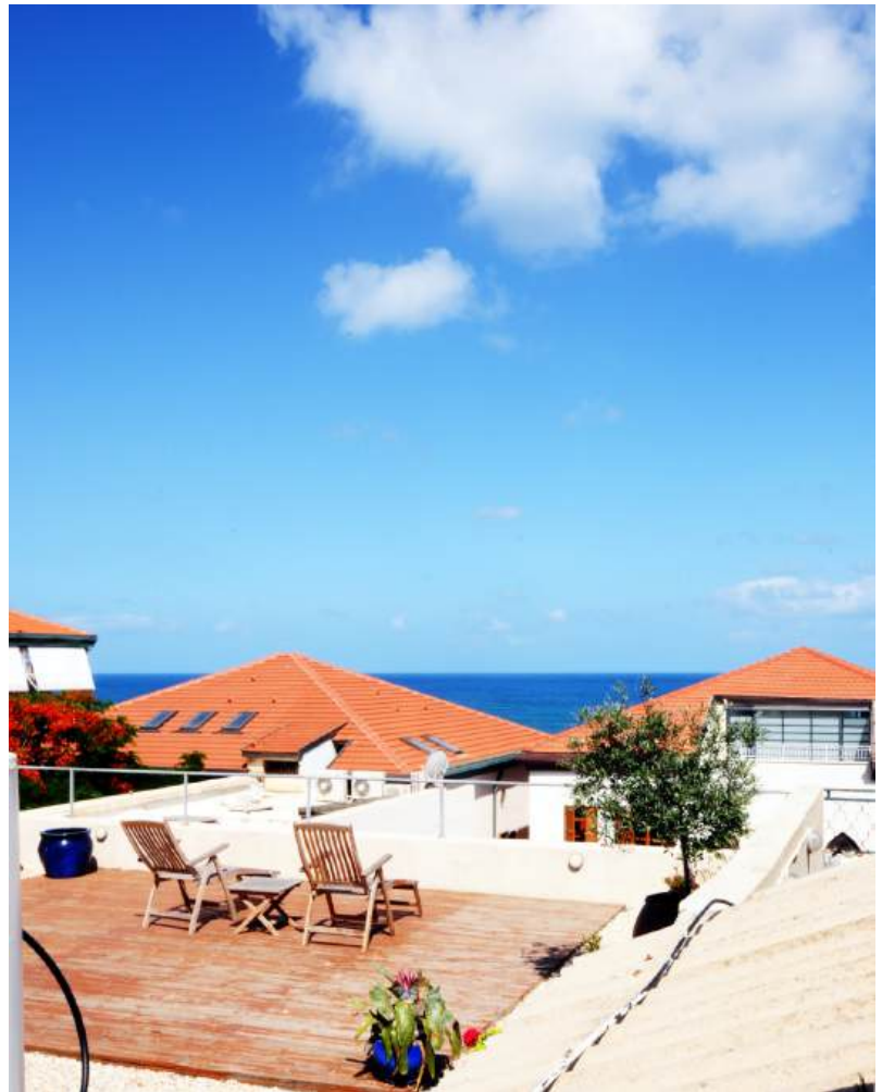
הבונוס הגדול: זולה על הגג. במת עץ מקורה ומושבים רכים מאפשרים להתרווח מול נוף העיר

ועם זאת אינו ניצב בחלל כאלמנט קבוע התופס מקום. בגג עצמו תוכננה "זולה" משובבת עין שנבנתה על טהרת העץ ומזמינה להתרווח בשטחה וליהנות מנוף הים ונוף העיר שנחשפים ממנה. וכשזו מצטרפת להנאה הנעימה שמזומנת גם בפטיו הכניסה, נראה שעם כל מגבלות השטח והתקציב ש"פתחו" את התהליך, על המרחב החדש שנוצר בסופו ניתן גם ניתן להחיל את האמרה שהשלם עולה על סך כל חלקיו.