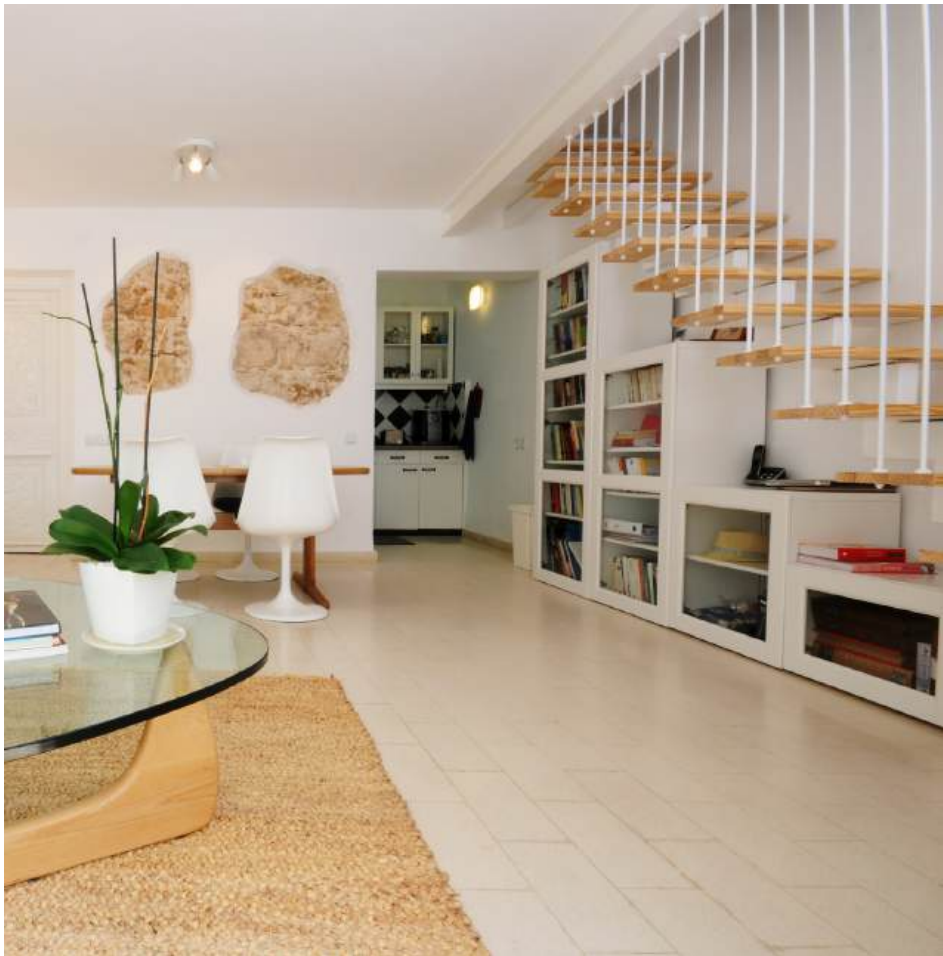
חלל המדרגות: שטח קיר שננגס מחדר השינה מנוצל לשמש כגומחה חיצונית הפונה לחלל המדרגות ומאכלסת ספרייה.