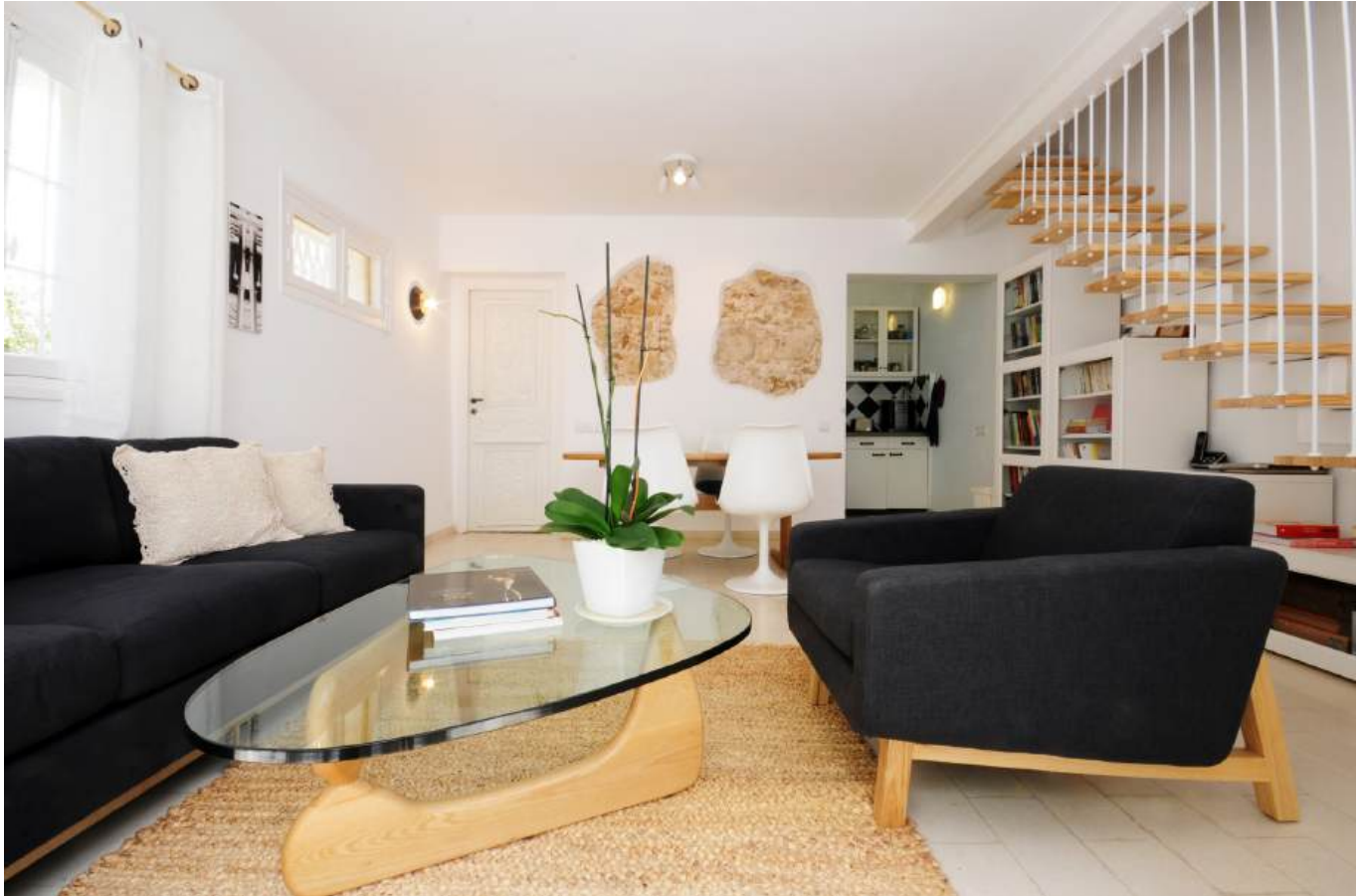
גרם המדרגות במיקומו החדש הצמוד לקיר בסמוך לכניסה. עיצוב קל ואוורירי משלב מתכת ועץ צבוע לבן, כאשר החלל תחתיו מנוצל למיקום יחידת ריהוט שתוכננה בהתאמה למהלכו בקו מדורג.