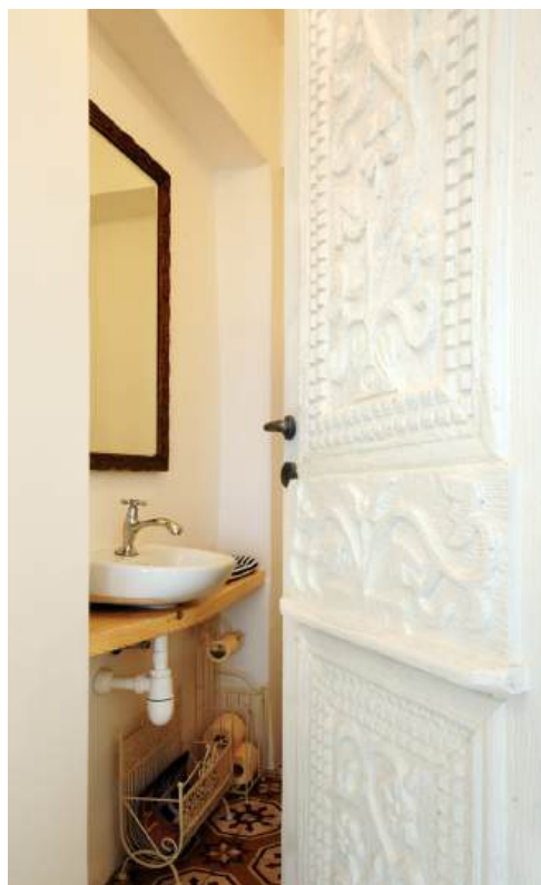
שירותי אורחים: חלל חדש שהתקבל עם העתקת גרם המדרגות. דלת דקורטיבית ישנה ששופצה ונצבעה בלבן, ריצוף באריחים מצוירים, ואלמנטים בסגנון רטרו.