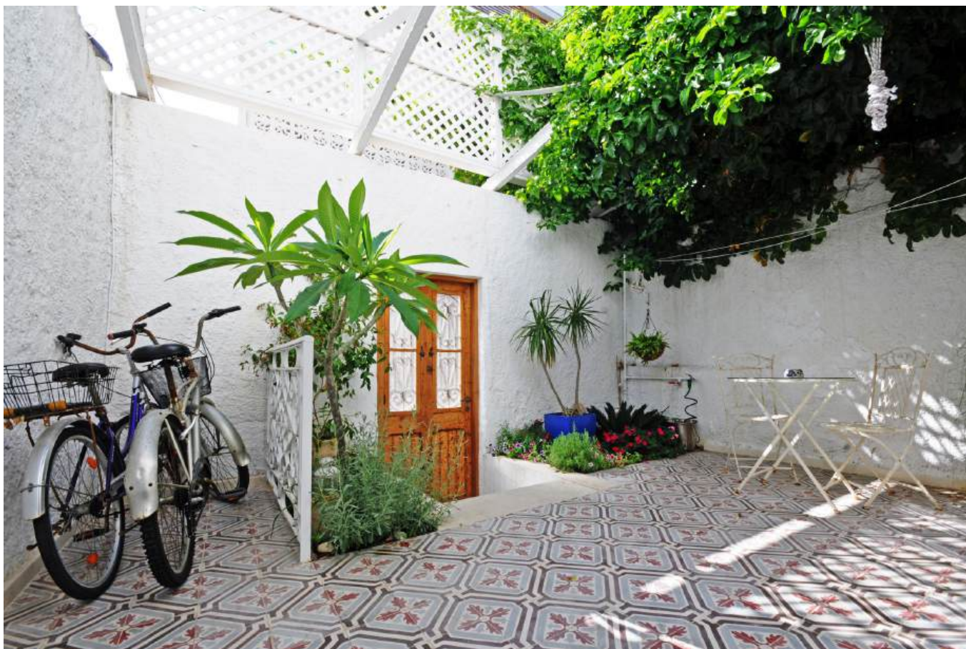
חצר פטיו בכניסה לבית. ריצוף באריחים מצוירים ותחושה מזמינה.